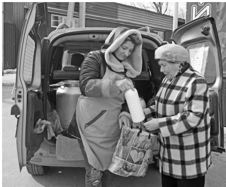
Торговля на ул. Проспект Мира в п. Думиничи.